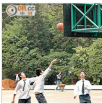
醫知健：撞甩牙應放回原位