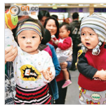
醫知健：維他命D強化胎兒肌肉